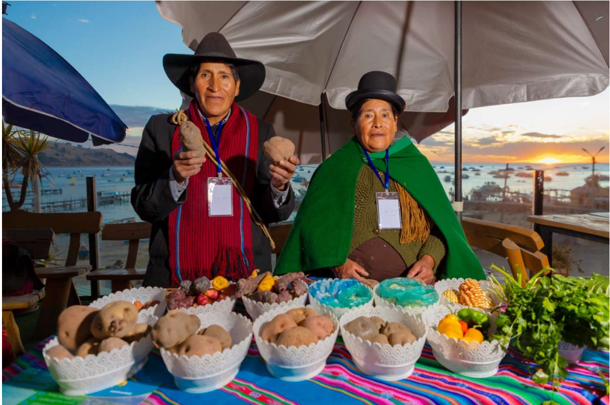
Indigene Führungspersonlichkeiten, die sich für Sortenvielfalt und Umweltschutz einsetzen, mit ihren Feldfrüchten, Copacabana, Bolivien