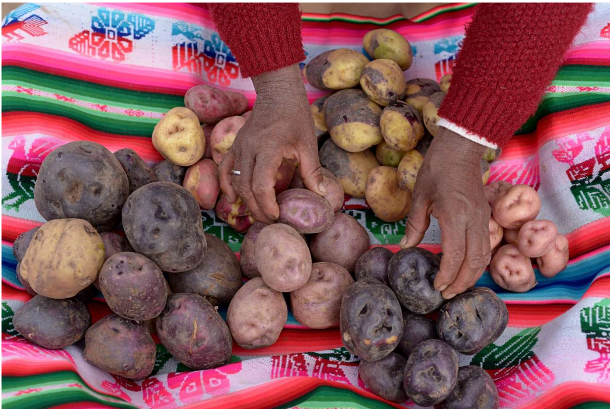
Vielfältige Kartoffelsorten in Arapa, Peru

In Zusammenarbeit mit Mission 21 unterstützt die Reformierte Kirchgemeinde Oberwil-Therwil-Ettingen ein Projekt zur Ernährungssouveränität in den Anden .