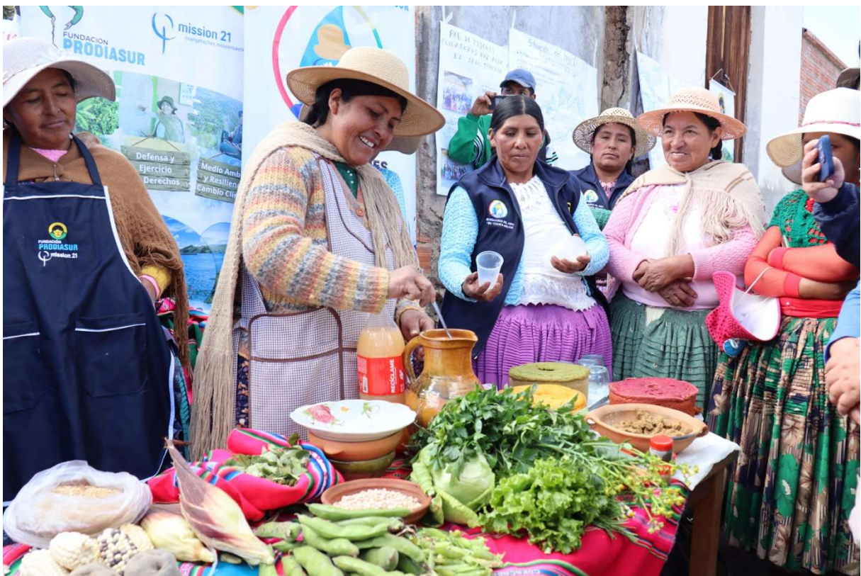
Frauen präsentieren in der Nähe von Copacabana in Bolivien ihre eigenen auch verarbeiteten Produkte, welche sie auf dem Markt verkaufen können